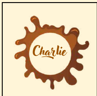
Chocolat au lait (logo original)